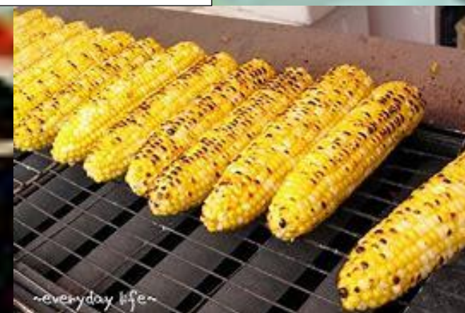
九頭竜トウモロコシ

親：越前大野、九頭竜の特産品だよ。ガオー！ 子：どれでも美味しそうだ。ギャオーギャオー。 親：全部いただき。ガオガオー！ 子：ダメダメ。僕にもちょうだい！ギャオーギャオー。