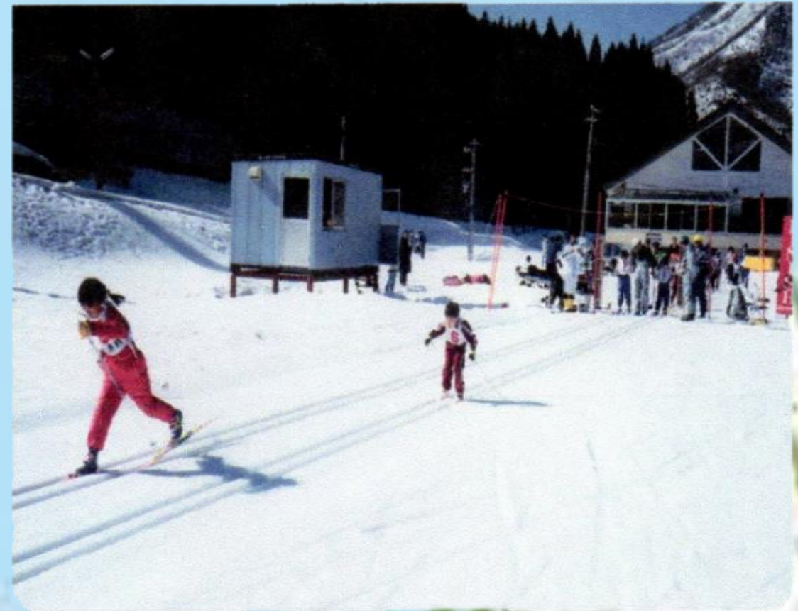
DAINOUSポーツランド 大野市上大納