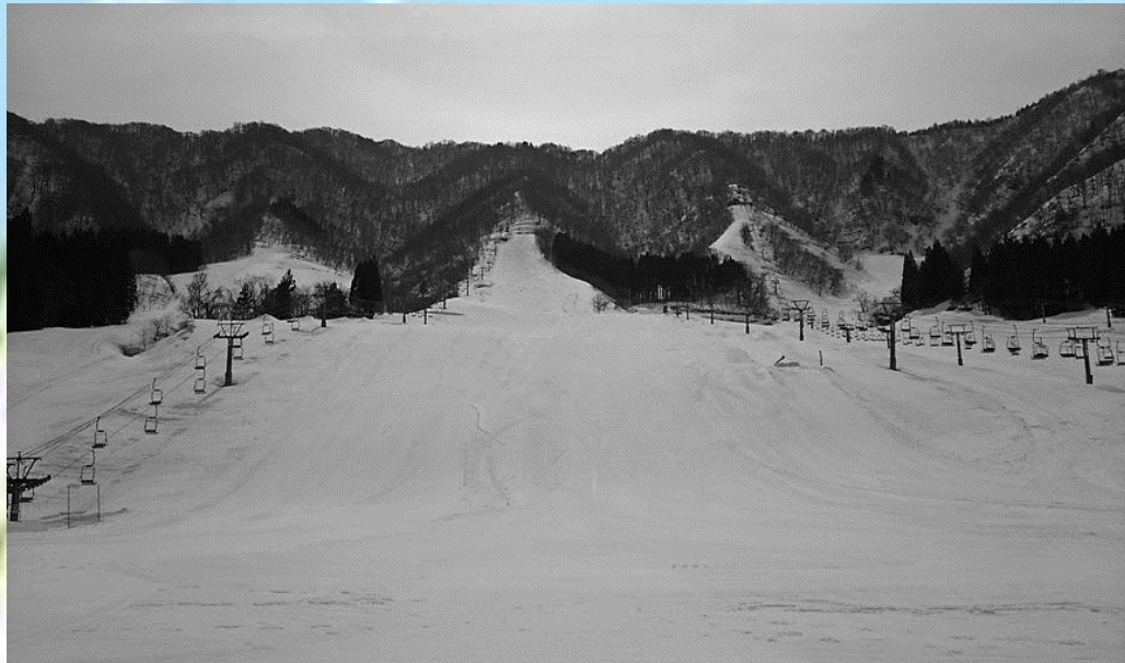
会場：九頭竜スキー場 福井県大野市角野

この競技会場では、毎年福井県スキー選手権大会で行われるそうです。5月には新緑まつり、10月には紅葉まつりを行います。